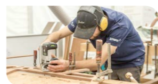
Unterhalt &amp; Reparaturen

HENSA Lago Marina 8852 Altendorf c.technology AG Engel & Völkers Graf Bootswerft Kielwasser AG Landolt Engineering AG Neidhart Stäfa AG